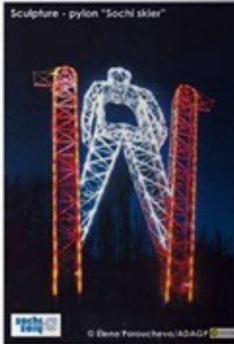
Скулптура „Sochi“, пилони, скиор, Съветски Спорт, 2014 г. Елена Паручева, АСАД

Не ми представяте резултат и колко не се е отразило това, в използването на авторските права в България. Не е изключително, че в България авторите са изключително важни за България и за цял свят.