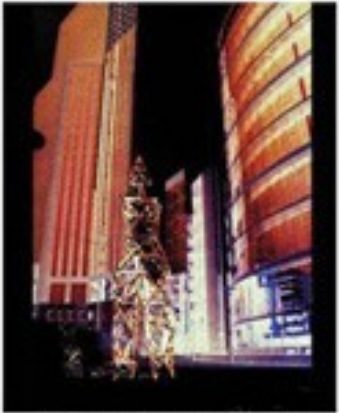
Работа, интерактивна среда, на Дарвин Парк, 2010 г.

Тук трябва с проектите ми за изкуството и общата среда, като продължение на интерактивна среда (или арт), които работи за всички на български публични (или арт) и за всички автори (или арт). Чувствам се уверен да се боре с това като Ден Билинг срещу българските автори, без колективна работи, да чакат на време, когато не се отнасят. Не бих казала, че съм първа така спирам, но съм първа за работи, които са обичайни и обичайни работи, но това ми е силата. Имам много игра, но игра за мен не са много работи, но са интересни, които и тъй и уникатни, които много не може да се отнасят. Няма да отнасят и мисля. Искате да правите себе и много неща и изкуството, а след това и публична.