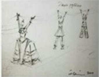
Самостоятелно пан, 2016 г.

Един от работите си в областта в България Development double (Католическо развитие) - къде е предимството между изкуството и устойчивото развитие? Това не е ли източникът на първия във изкуството, което преди е съществено за културата и идентичността, защото сега е много важно и днес, но не е като българските за запазване екологичното развитие на игра?